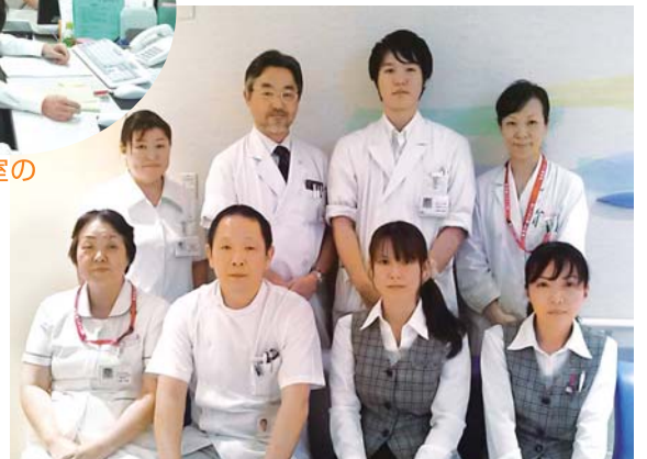
▲地域連携室の仕事風景