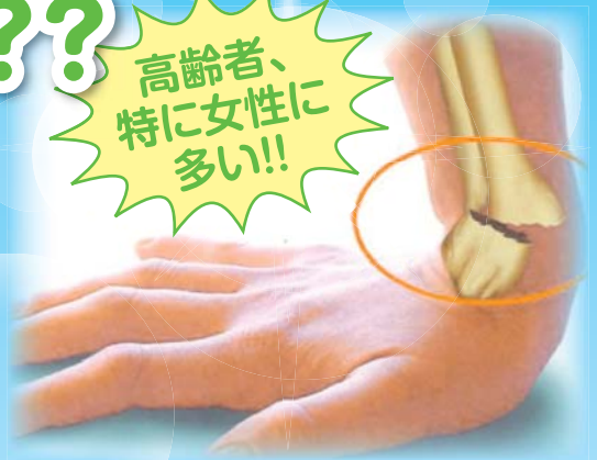
とうこつ えん い たん こっせつ 橈骨遠位端骨折 (コーレス骨折)