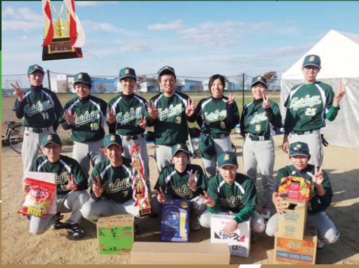
トロフィーは1階受付横に展示してあります。

頼もしい守備に助けられ、楽しくプレーできました! 3位でしたが、守備力は1位だったんじゃないかなと思います。