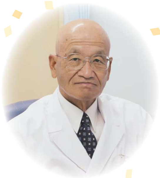
社会医療法人盛全会 岡山西大寺病院 院長