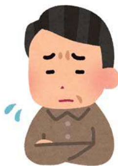
部位別がん罹患数 【男性2018年】

進行するまでは、ほとんど症状はありません。 そのため、検診で早期発見することは、その後の治療を考えても非常に重要です！