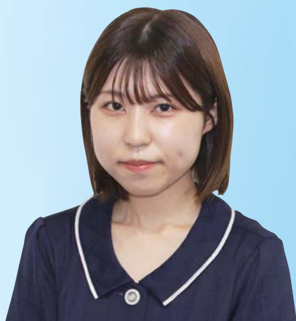
医療ソーシャルワーカー