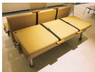
ストレッチャー になる長椅子