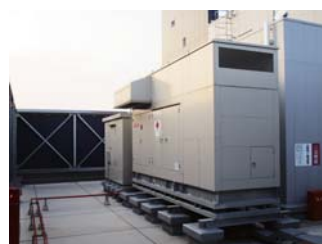
7Fに設置した 自家発電(免震)