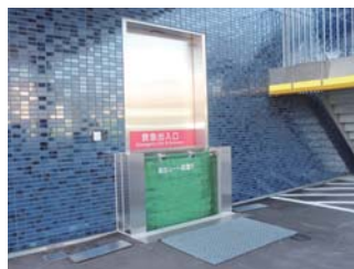
浸水を防ぐ為の 防水シート