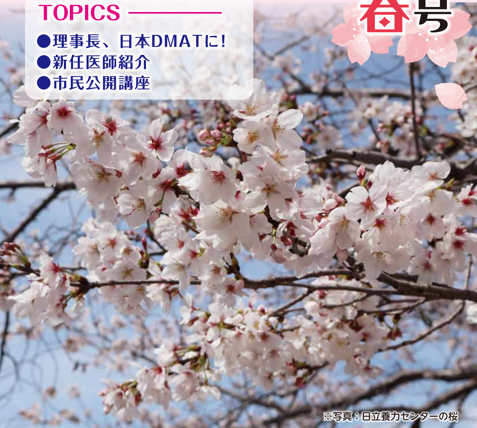
※写真：日立養力センターの桜